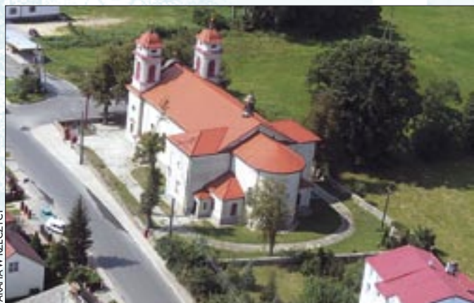
PARAFIA W RZECZYCY